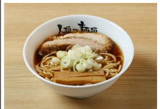
<らーめん原点 厚切り焼豚>

らーめん原点のほか、おにぎりとお生ビール「ヒューガルデン ホワイト」等を予定しております。